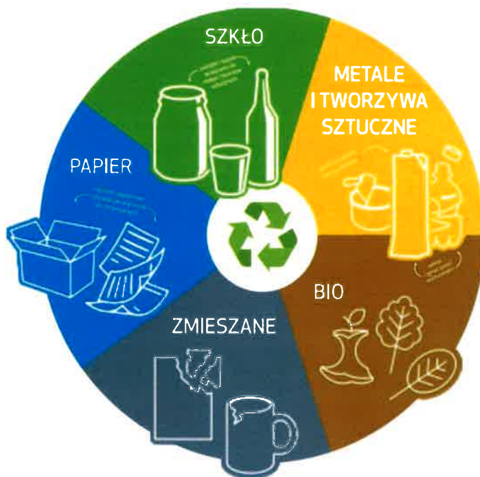
Rys.1. Odpady zbierane w sposób selektywny [1].

Mieszkańcy gminy mogli także pozbywać się, w ramach ponoszonej opłaty, odpadów gromadzonych selektywnie w Punkcie Selektywnej Zbiórki Odpadów przy ul. Wyzwolenia 19 w Ładzicach. W PSZOK dwa razy w miesiącu zbierane były następujące rodzaje odpadów: